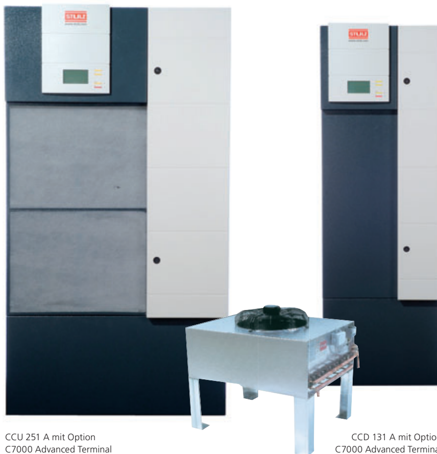
CCU 251 A mit Option C7000 Advanced Terminal

Im Gegensatz zu Komfortklimageräten, die nicht für den Dauerbetrieb ausgelegt sind, sorgt MiniSpace EC Mikroprozessor-geregelt an 365 Tagen im Jahr rund um die Uhr für ein exakt definiertes Klima in engen Toleranzen.