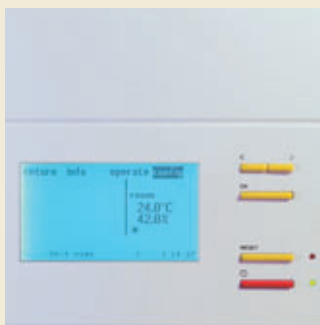
Benutzer-Interface C7000 Advanced

5) Kondensator für Geräte Typ A mit R407C, Kondensationstemperatur 45°C, Umgebungstemperatur: 32°C