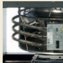
EC-Ventilator mit optionaler Elektroheizung