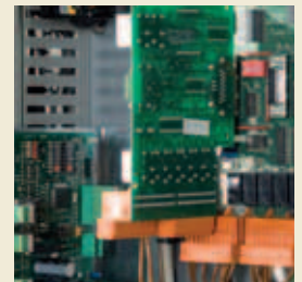
C7000-IOC mit optionaler analoger Erweiterungskarte