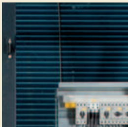
Wärmetauscher mit hydrophiler Lamelle